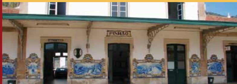
Estação Ferroviária do Pinhão