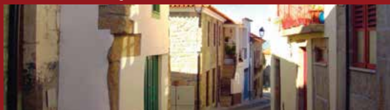
Aldeia Vinhateira de Barcos, Tabuaço