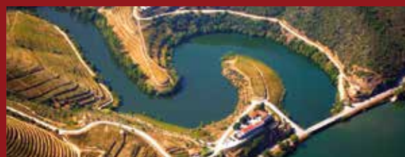
Estrada de acesso ao Hotel