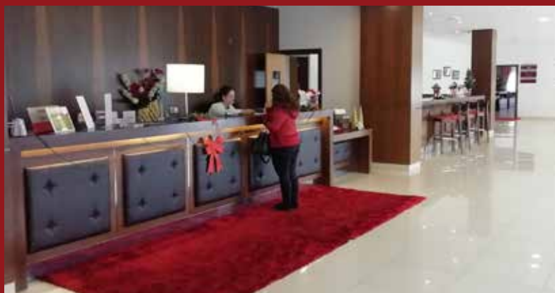
Receção do Hotel

Reservas: 00 351 254 780 140 • E-mail: hoteldourotabuaco@gmail.com