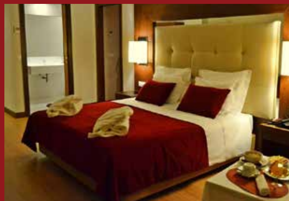
Quarto de Casal