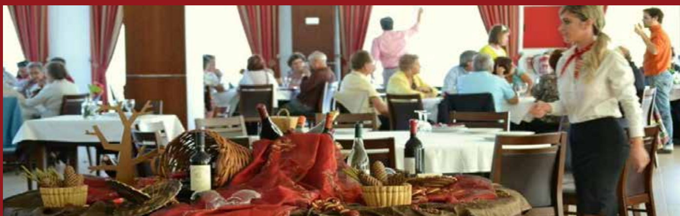
Restaurante do Hotel