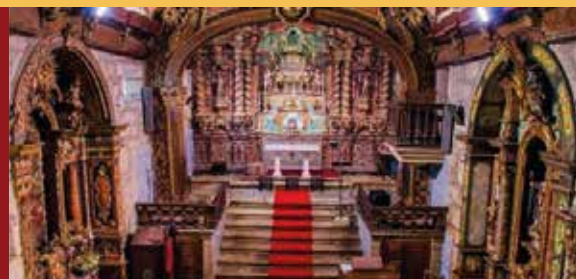
Igreja de Granja do Tedo